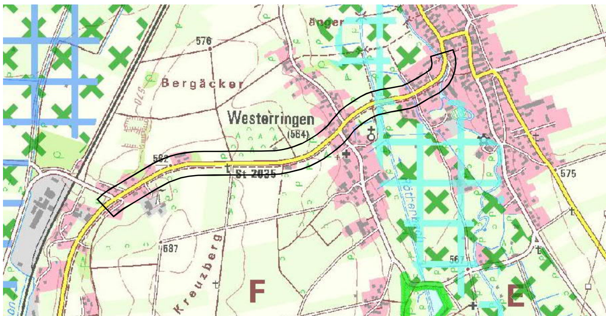
Abb. 2: Regionalplanerische Festsetzungen im Bereich des Untersuchungsgebiets: Landschaftliches Vorbehaltsgebiet "Singoldtal" (x) sowie Wasserwirtschaftliches Vorranggebiet zur Sicherung des Hochwasserabflusses "Singold" (x)

Im Regionalplan der Planungsregion Augsburg (vgl. Ausschnitt in Abb. 2) wird die Ausweisung des Singoldtales als landschaftliches Vorbehaltsgebiet (Ziel B I 2.1) u.a. mit seiner landschaftsgliedernden Funktion für die biotoparmen Hochterrassenflächen südlich von Schwabmünchen begründet. Außerdem wird die Singoldau zur Sicherung des Hochwasserabflusses und -rückhalts als Vorranggebiet H15 ausgewiesen (Ziel B I 4.4.1.2).