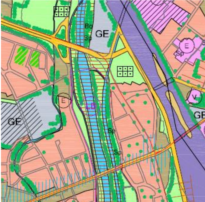
Abbildung 2: Auszug Flächennutzungsplan der Stadt Augsburg, Stand 2010

Maßgeblich für die Einstufung der Schutzbedürftigkeiten sind bestehenden rechtsverbindliche bzw. planerisch hinreichend konkretisierten Bebauungspläne. Im Umfeld der Baumaßnahme existiert ein Bebauungsplan, Nr. 810 „Für das Gebiet zwischen Wertach und Wertach-Kanal nördlich der Luitpoldbrücke“. Festgesetzt ist dort eine Sondergebietsfläche für Anlagen und Vorhaben für den Gemeinbedarf und für sportliche Zwecke. Für die dort gelegenen Nutzungen erfolgt die immissionsschutzrechtliche Einstufung entsprechend von Mischgebieten.