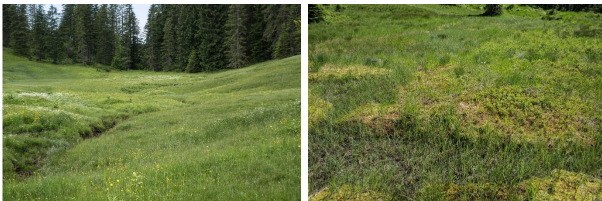
Abb. 8: Kalkreiches Niedermoor im Ziebelmoos mit kleinen Nasswiesen-Einsprengseln (links) und Bult-Schlenken-Komplex (7110* - Lebendes Hochmoor) am Scheuenpass mit kleinen Vaccinien-Heiden (4060 – Alpine und boreale Heiden) (rechts) (Fotos: U. Kohler).