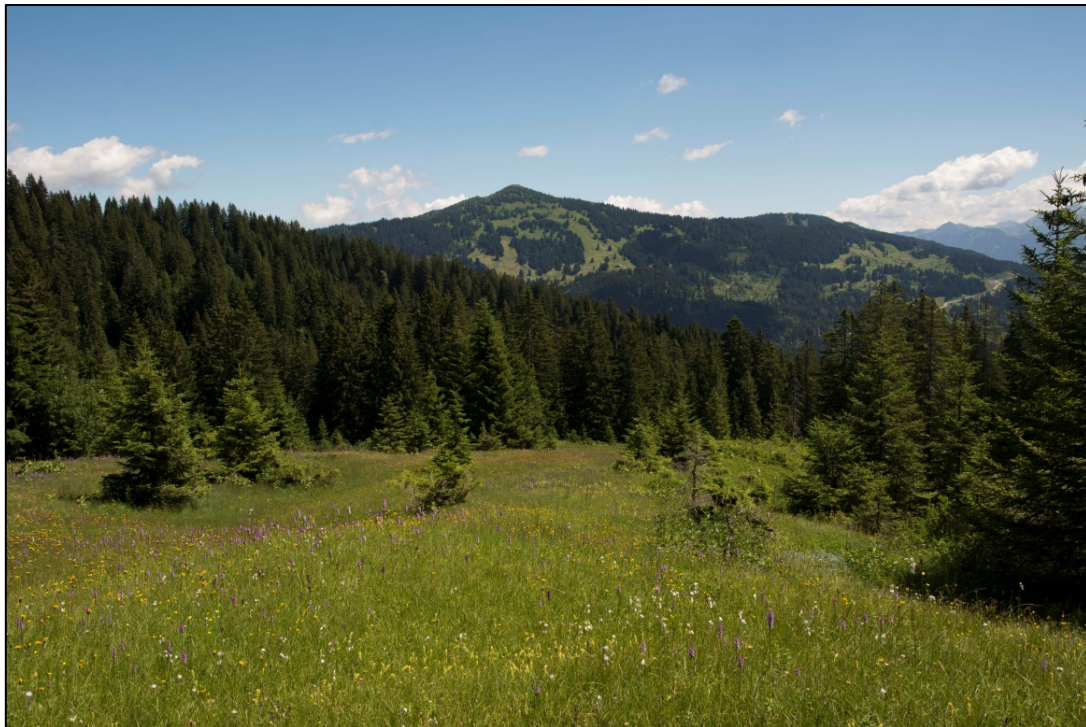
Abb. 1: Kalkreiches Niedermoor auf der Roßschelpe-Alpe

Kurzinfo zum Managementplan - Stand September 2020