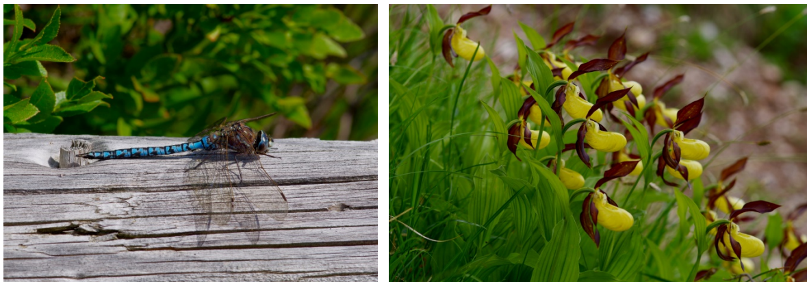
Abb. 7: Alpen-Mosaikjungfer ( Aeshna caerulea ) beim Sonnenbad (links) und blühende Frauenschuhe am Stubbengraben (rechts) (Fotos: B. Mittermeier, AELF Krumbach).

FFH-Richtlinie geführten Frauenschuhs ( Cypripedium calceolus ) entdeckt, der bisher nicht im Standarddatenbogen gelistet ist.