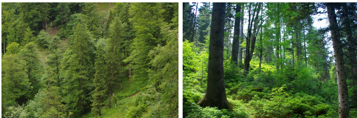
Abb. 6: Rundblattlabkraut-Tannenwälder (LRT 9134) im Bereich des Stubengrabens (links) und montaner Waldmeister-Buchenwald (LRT 9131) am Kälberrücken (rechts) (Fotos: B. Mittermeier und A. Walter, AELF Krumbach).

Der „ Rundblattlabkraut-Tannenwald “ (LRT 9134) ist ein für die kühl-feuchten Bedingungen der Piesenkopfmoore besonders charakteristischer Lebensraumtyp und tritt im Gebiet großflächig und in naturnahem Zustand auf insgesamt 90 Hektar auf. Er ist an Wasserüberschussstandorte wie vernässte Hänge oder staufeuchte Mulden gebunden, auf denen die Weißtanne die dominante Hauptbaumart ist, während Fichte, Buche oder Bergahorn ins zweite Glied rücken.