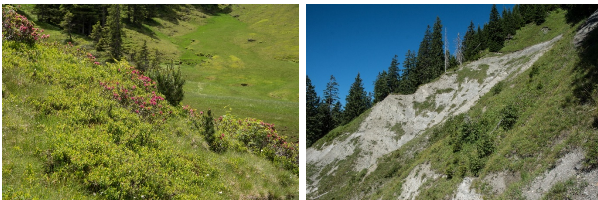
Abb. 3: Komplex aus Rost-Alpenrosenheiden und Borstgrasrasen an der Nordseite des Piesenkopfs (links) und Blaugras-Horstseggenrasen (Alpiner Kalkrasen) und Mergelschutthalde (LRT 8120 – Kalkschutthalde der Hochlagen) am Rehköpfer (rechts).

„ Alpine und boreale Heiden “ (LRT 4060) und Borstgrasrasen („ Alpine Silikatrasen “, LRT 6150) sind im FFH-Gebiet häufig in Komplexen zu finden. Sie konzentrieren sich auf die lange schneebedeckten Nordwest- bis Nordosthänge des Piesenkopfs über sauren Sandsteinen der Feuerstätter Decke und silikatischer Fernmoräne sowie auf den Hangrücken des Scheuenpasses. Alpine Silikatrasen wurden auf rund 40 ha (13 Teilflächen) in überwiegend hervorragendem Erhaltungszustand (A) erfasst. Alpine und boreale Heiden sind in 6 Lebensraumtypflächen auf ca. 13 ha Fläche zu finden. Ihr Erhaltungszustand ist in der Summe hervorragend (A).