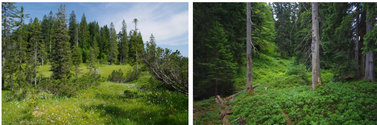
Abb. 5: Komplex aus Fichten- und Bergkiefern-Moorwald (LRT 91D4*, 91D3*) und Übergangsmooren im Ziebelmoos (links) und Subalpine Fichtenwälder (LRT 9410) oberhalb der Gauchenwände (rechts) (Fotos: B. Mittermeier, AELF Krumbach).