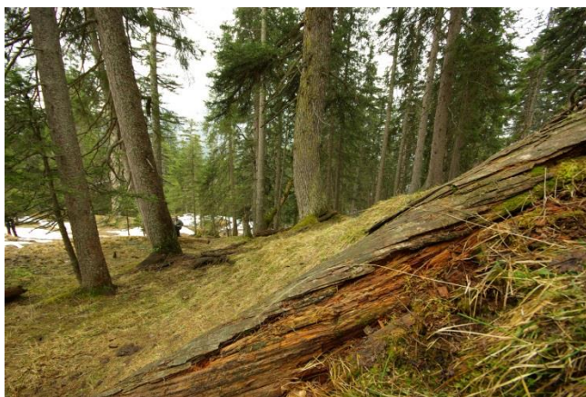
Abb. 6: Subalpiner Fichtenwald westlich des Aggenstein-Gipfels im Bereich des Seekopfes (LRT 9410).

Montane bis alpine bodensaure Fichtenwälder (Vaccinio-Piceetea) (LRT 9410) sind mit ca. 15,5 ha der am häufigsten vorkommende Wald-Lebensraumtyp im Gebiet. Sie bilden in den nördlichen Kalkalpen die natürliche Waldgrenze. Teile davon werden beweidet und bilden eine eigene Bewertungseinheit. Insgesamt ist der Erhaltungszustand günstig.