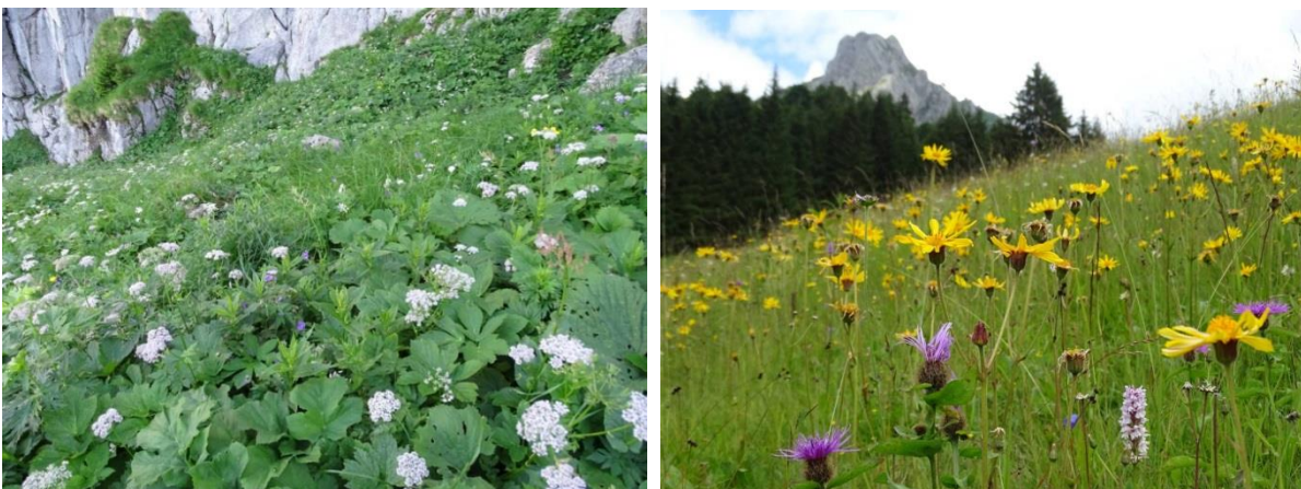
Abb. 5: Alpine Hochstaudenflur am Fuß des Aggensteins in sehr gutem Erhaltungszustand (links) und Bergmähwiese mit Perücken-Flockenblume, Fuchs-Knabenkraut und Arnika (rechts).

Alpine Kalkrasen (LRT 6170) bilden am Aggenstein mit 47,69 ha und 29 Teilflächen die größten Flächenanteile der Lebensraumtypen. Kennartenreiche Polsterseggenrasen wechseln sich mit wärme-liebenden Blaugras-Horstseggenrasen ab und bilden zusammen mit Felsfluren ein beeindruckendes Mosaik.