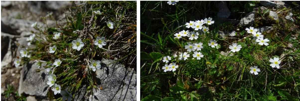
Abb. 7: Wimper-Sandkraut (links), Milchweißer Mannsschild in Felsspalten und Felsrasen (rechts).

Zudem treten im FFH-Gebiet eine große Zahl von Arten der Roten Liste Bayerns und Deutschlands auf, die nicht im Anhang II der FFH-Richtlinie gelistet sind und daher im Rahmen dieses Managementplanes nicht näher untersucht wurden. Zu diesen floristischen Besonderheiten zählen unter anderem der gefaltete Frauenmantel ( Alchemilla plicata ) in den Berg-Mähwiesen, das Schweizer Mannsschild ( Androsace helvetica ), der östlichste bekannte Wuchsort des Wimper-Sandkrauts ( Arenaria ciliata ssp. multicaulis ) und der einzige bekannten Wuchsort der Felsen-Segge ( Carex rupestris ) in den Bayerischen Alpen und die Berg-Esparsette ( Onobrychis montana ).