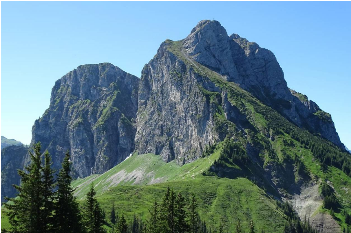
Abb. 1: Aggenstein von Nordwesten

Runder Tisch zur Managementplan-Bearbeitung am 06.11.2019