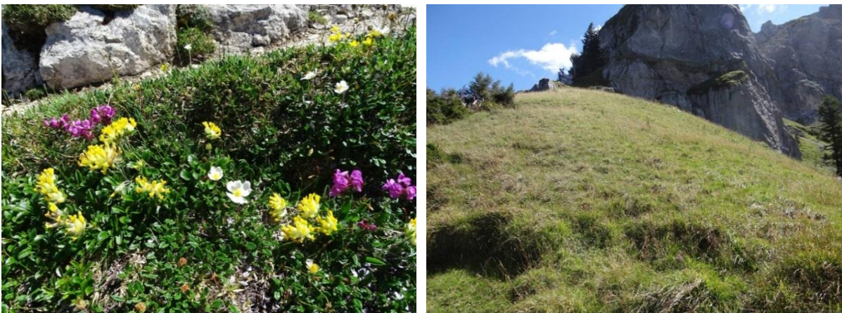
Abb. 4: Polsterseggenrasen (Bsp. für LRT 6170) in hervorragendem Erhaltungszustand am „Langen Strich“ nordwestlich des Aggensteins (links) und durch Brache vergraste Borstgrasrasen (Bsp. für LRT 6150) nördlich des Brentenecks (rechts) (Foto: AVEGA).