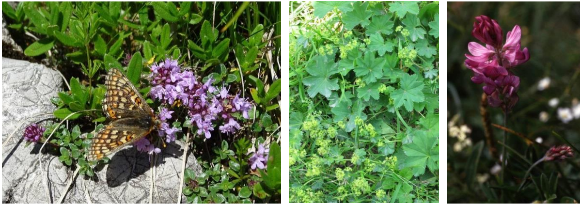
Abb. 6: Skabiosen-Scheckenfalter (links), Gefalteter Frauenmantel in Berg-Mähwiesen (LRT 6520, Mitte), Berg-Esparsette im Kalkrasen (LRT 6170, rechts).