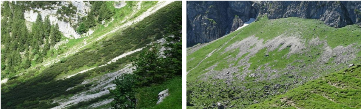
Abb 3: Latschengebüsche im östlichen Abschnitt des FFH-Gebiets (links) und Kalk-Schutthalden am Nordabfall des Aggensteins (Foto: AVEGA).

Der dominante LRT sind die Alpinen Kalkrasen (LRT 6170) , gefolgt von den Kalkfelsen mit Felsspaltenvegetation (LRT 8210) und den Latschen- und Alpenrosengebüschen (LRT 4070*) .