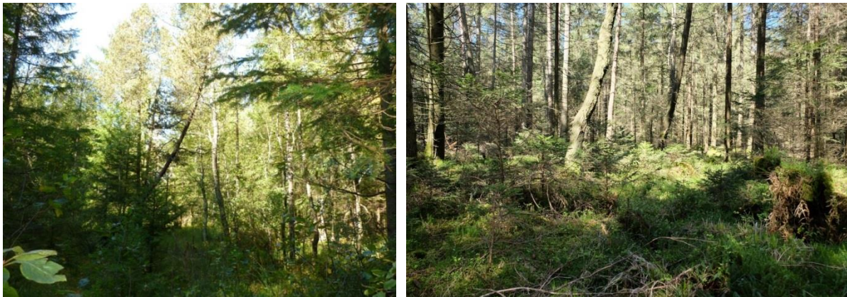
Abb. 5: Birken-Moorwald am Westrand des Elbsees (links), Fichten-Moorwald im Süden des Elbsees (rechts) (Foto: A. Walter).

Westlich des Elbsees befindet sich noch eine 0,7 ha große Fläche des Moorbirken-Moorwaldes (LRT91D1*) . Er ist zwar noch in einem guten Erhaltungszustand (B), es ziehen sich aber einige Gräben durch und die Verjüngung der Moorbirke wird durch Wildverbiss beeinträchtigt.