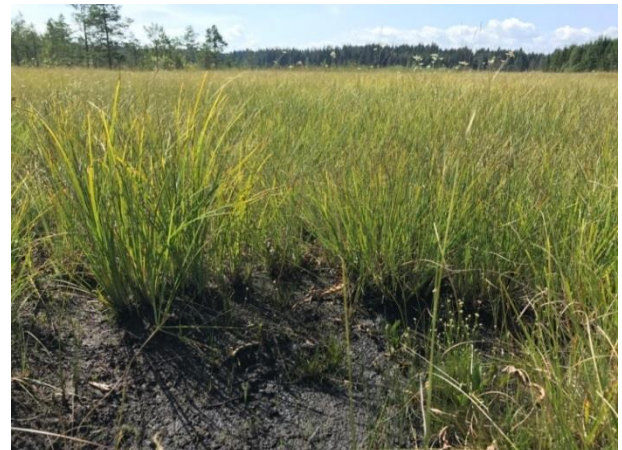
Abb. 4: Noch renaturierungsfähiges degradiertes Hochmoor (links), Übergangsmoor im Zentrum des Gebietes (rechts) (Foto: A. Mittelbach).

Mit 7,2 ha verteilt auf 15 Teilflächen bilden die Übergangsmoore (LRT 7140) die größte Fläche der Offenland-Lebensraumtypen. Kleinräumige Übergänge vom Fadenseggenried zu den wachsenden Torfmoospolstern sind durch das Vorkommen charakteristischer und besonders seltener Arten gekennzeichnet. Die Übergangsmoore wurden mit einem sehr guten Erhaltungszustand (A) bewertet.