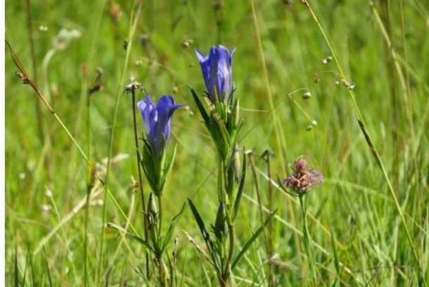
Abb 3: Elbsee mit Gewässervegetation (links), Pfeifengras-Streuwiese mit Lungen-Enzian (Foto: S. Kuffer).