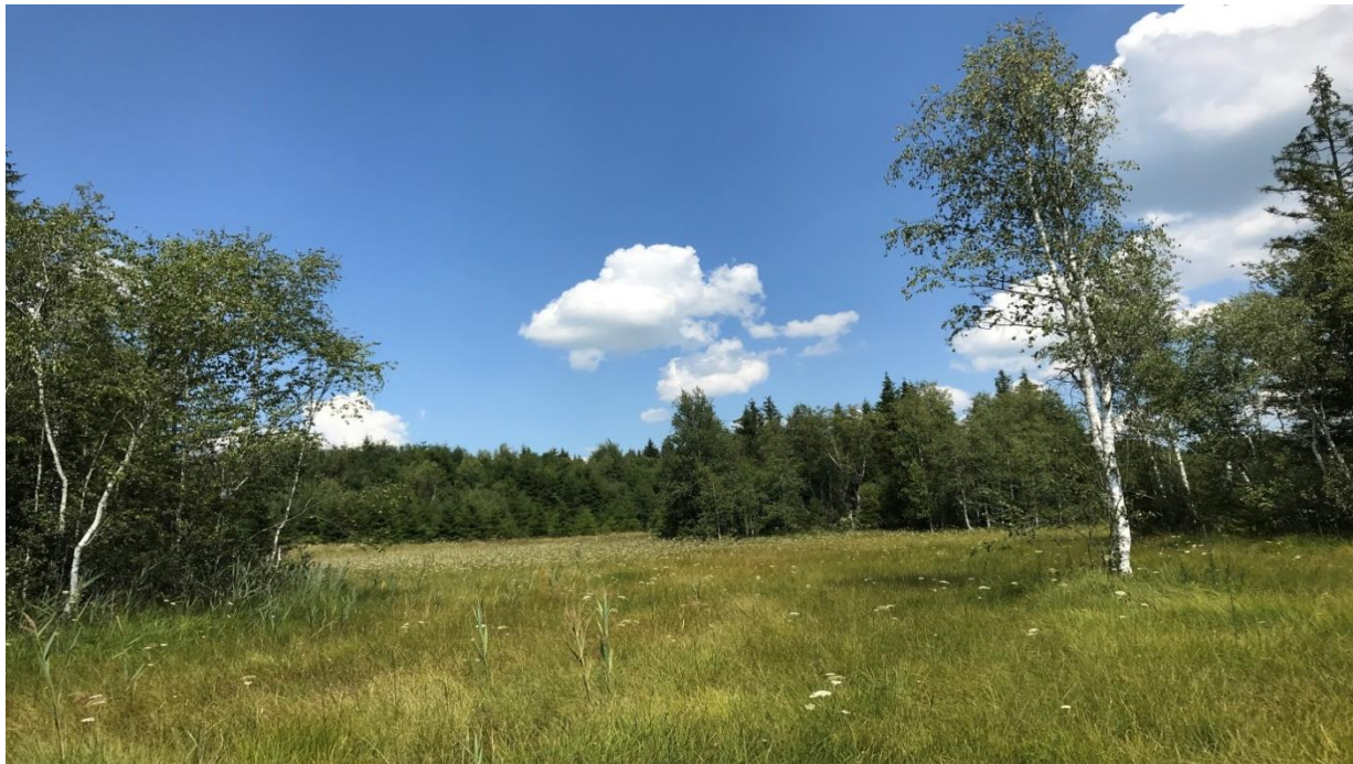
Abb. 1: FFH-Gebiet „Elbsee“

Runder Tisch zur Managementplan-Bearbeitung am 26.02.2019