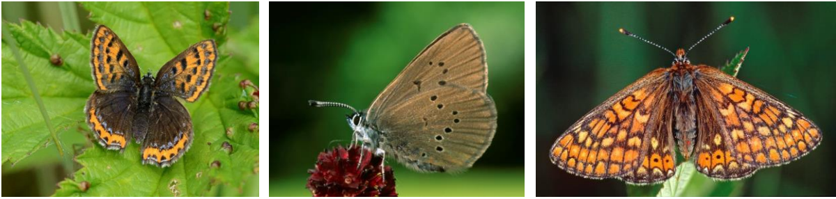
Abb. 6: Blauschillernder Feuerfalter (links), Dunkler Wiesenknopf-Ameisenbläuling (Mitte), Skabiosen-Schneckenfalter (rechts).

Im Alpenvorland ist der Skabiosen-Schneckenfalter ein typischer Bewohner der Streuwiesen und Kalkflachmoore und ihrer noch offenen Sukzessionsstadien. Die wichtigste Eiablage- und Wirtspflanze ist der Teufelsabbiss. Im FFH-Gebiet Elbsee liegen nur wenige Nachweise westlich des Elbsees vor. Der Erhaltungszustand ist insgesamt als gut (B) eingestuft.