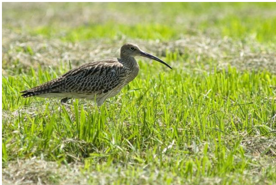
Grosser Brachvogel ( Numenius arquata )

Wertgebend für das Eppisburger Ried sind die Wiesenbrüter Brachvogel und Kiebitz; vereinzelt kommt auch die Wachtel und die Schafstelze vor. Der Erhaltungszustand des Großen Brachvogels und der Wachtel wurde mit C (mittel – schlecht), der des Kiebitz mit B (gut) bewertet.