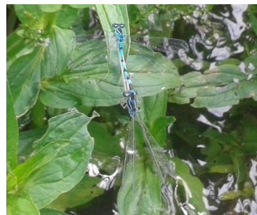
Vogel-Azurjungfer ( Coenagrion ornatum )