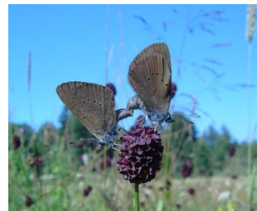
Dunkler Wiesenknopf- Ameisenbläuling ( Maculinea nausithous )