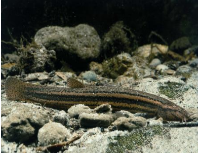
Schlammpeitzger ( Misgurnus fossilis )