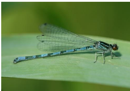
Helm-Azurjungfer ( Coenagrion mercuriale )

Im FFH-Gebiet wurden fünf Arten des Anhangs II der FFH-Richtlinie erfasst und bewertet. Der Erhaltungszustand von Helm-Azurjungfer, Vogel-Azurjungfer und Bitterling wurde mit B (gut) bewertet. Der Dunkle Wiesenknopf-Ameisenbläuling sowie der Schlammpeitzger erhielten die Bewertung C (mittel – schlecht).