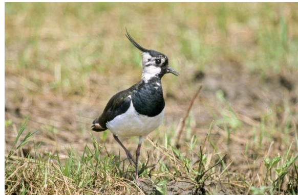
Kiebitz ( Vanellus vanellus )

Weitere Wiesenbrüterarten wie Bekassine, Braunkehlchen und Regenbrachvogel, kommen nur auf dem Durchzug bzw. in anderen Teilflächen des Donauriedes vor. Im Eppisburger Ried sind diese Arten als Brutvögel nicht nachgewiesen.