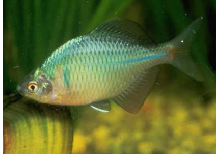
Bitterling ( Rhodeus amarus )