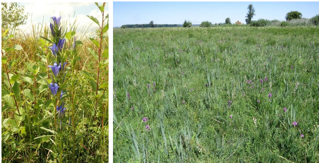
Abb. 3: Lungen-Enzian (links, Foto: W. v. Brackel) und Kalkflachmoor (rechts, Foto: W. v. Brackel).

Da Pfeifengraswiesen nur noch auf ca. 0,8 ha (0,4 % der Fläche des FFH-Gebiets) vorkommen, wird der Gesamt-Erhaltungszustand für den LRT 6410 mit C (schlecht) bewertet.