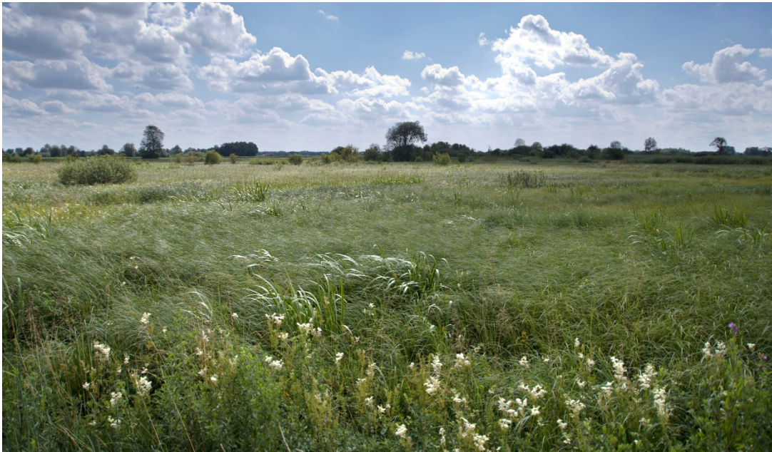
Abb. 1: NSG Gundelfinger Moos

Kurzinfo zum Managementplan – Stand Dezember 2021