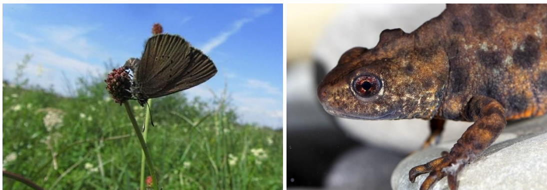
Abb. 4: Dunkler Wiesenknopf-Ameisenbläuling (links, Foto: H. Müller) und Kammolch (rechts, Foto: W. Gailberger).

dem 1. Juni bis spätestens 15. Juni). Der zweite Schnitt (oder bei einschürigen Wiesen oder Hochstaudenfluren der einzige Schnitt) muss so spät erfolgen, dass die Raupen bereits in die Ameisennester umgesiedelt sind; dies sollte erst ab Anfang September, optimal nach dem 15. September erfolgen. Der Gesamterhaltungszustand für die Art für das FFH-Gebiet insgesamt nur mit „C“ (mittel bis schlecht) einzustufen. Die Vorkommen im FFH-Gebiet beschränken sich auf zwei kleinflächige Teilhabitate mit jeweils sehr geringen Individuenzahlen. Auch die potentiellen Habitate stehen z.T. nur in geringer Ausdehnung bzw. Qualität (aktuelle Nutzung) zur Verfügung.