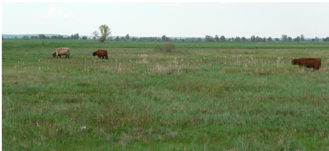
Abb. 5: Extensive Beweidung im Gundelfinger Moos

Hinweise für die Nutzung von Fach- und Rasterdaten: Nutzung der Geobasisdaten der Bayerischen Vermessungsverwaltung; Geobasisdaten: ©Bayerische Vermessungsverwaltung.